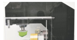
Estructura de la máquina de piedra de granito estable