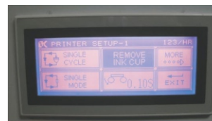
Control PLC de pantalla táctil