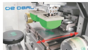
Movimiento de la plataforma entrada / salida para imágenes grandes