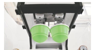
Dos tampones independientes