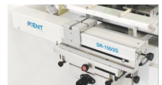
Accesorio de lanzadera neumática de 2 colores